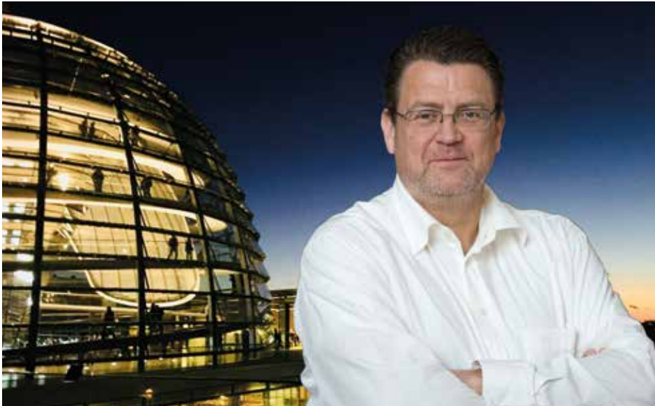
Aus der Fraktion der Alternative für Deutschland (AfD) im Deutschen Bundestag