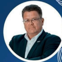
Stephan Brandner, MdB