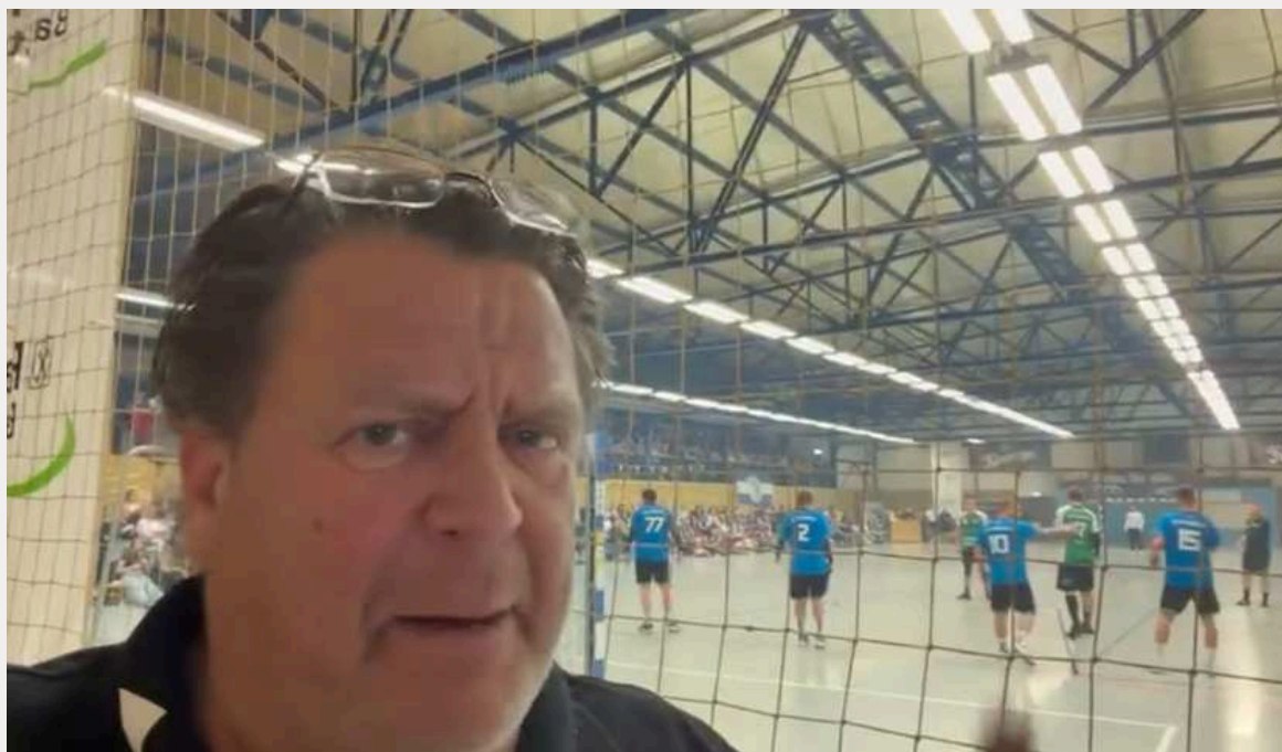
Im Hexenkessel von Ronneburg