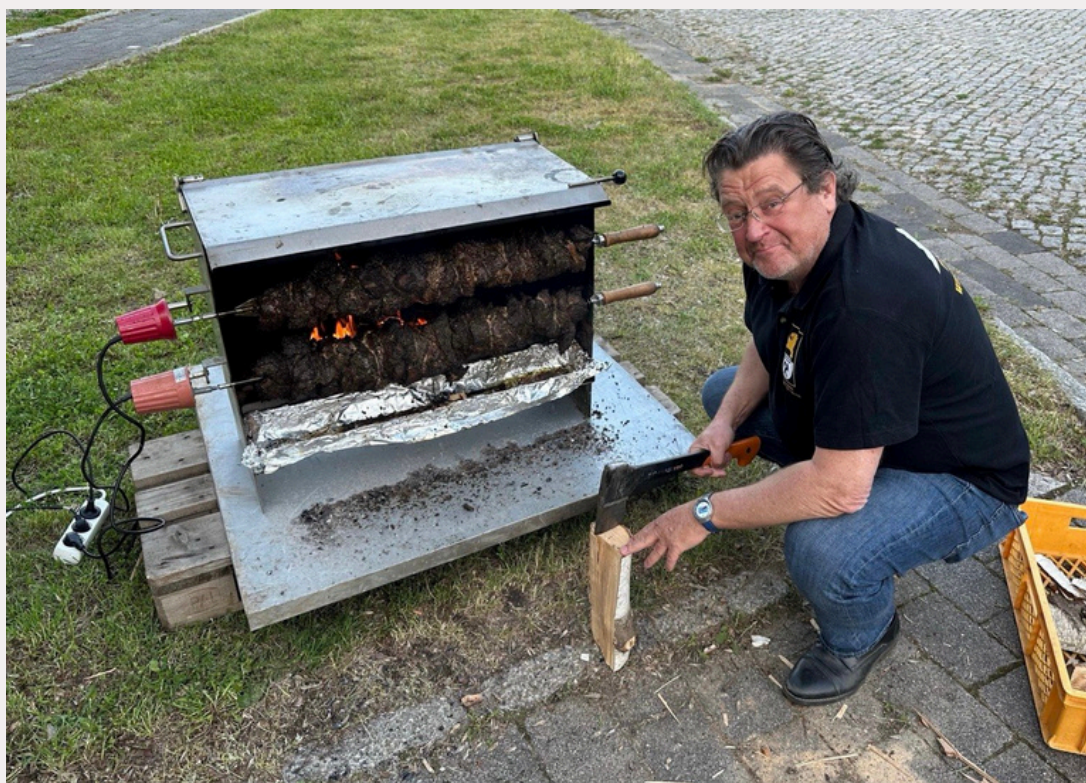
Mit dem Mutzbraten