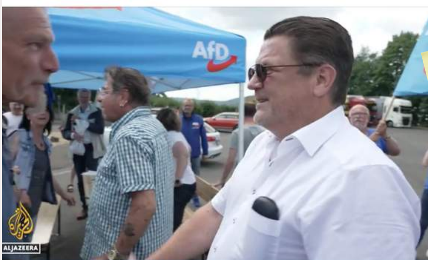
Germans look to the right: Once-taboo party more popular than ever