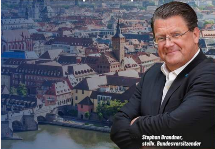
Stephan Brandner, stellv. Bundesvorsitzender