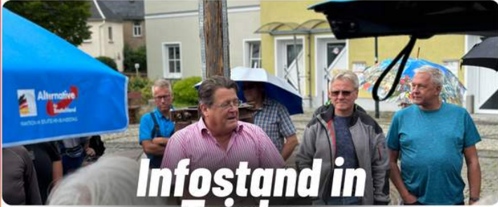
Infostand in Triebes