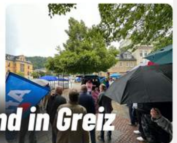
Infostand in Greiz