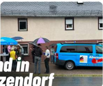
Infostand in Langenwetzendorf