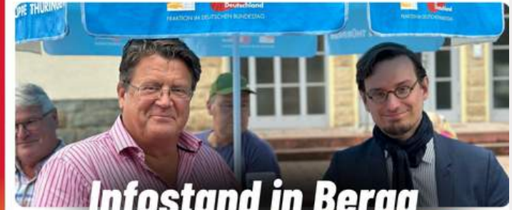
Infostand in Berga